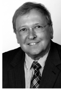
Alfred Busch 2. Beigeordneter