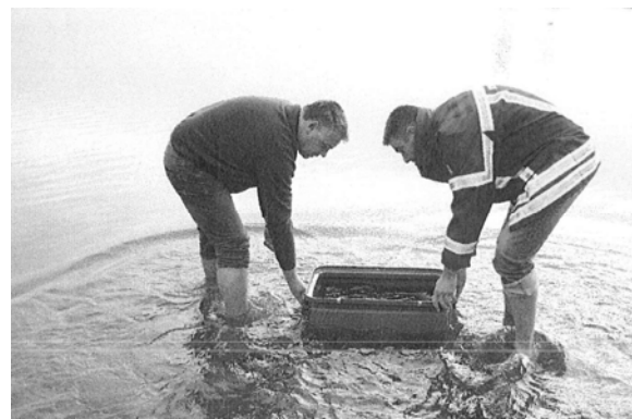
Der Wels wurde im Rhein bei Speyer ausgesetzt.