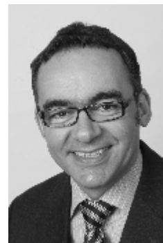
Ulrich Schöffel Fraktionssprecher